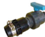
Válvula de Descarga

*Todos los conectores se entregan como kit (con abrazadera y su propio empaque) *En los conectores para Flexnet de 6" la apariencia puede cambiar