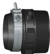
Conector FXN Roscado