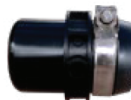
Tapón Final FXN