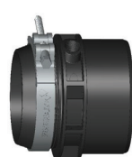
Conector FXN Cementar